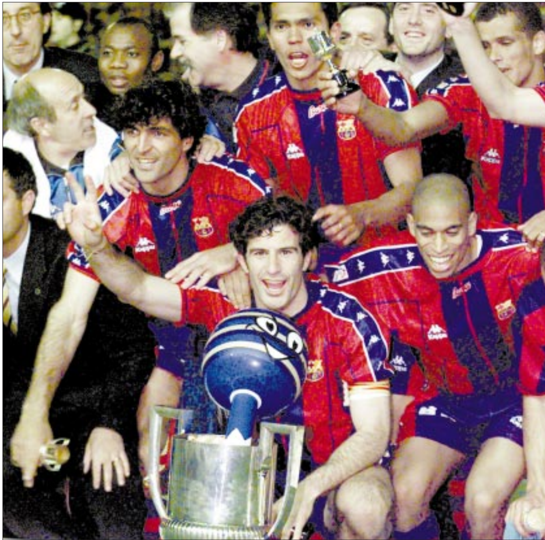
Los jugadores del Barcelona celebran el título con la copa de campeones.