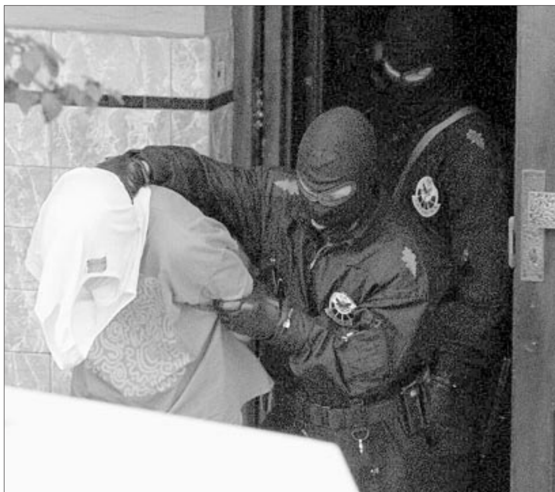
Dos ertzainas conducen a uno de los presuntos etarras detenidos el viernes en Gernika.

El subdelegado del Gobierno en la provincia burgalesa, Víc-