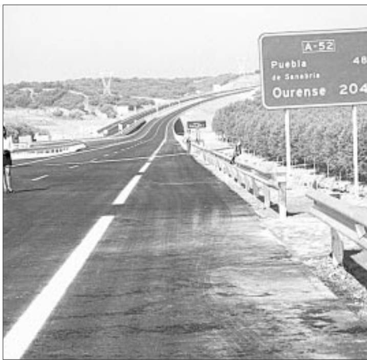
Tramo de la autovía A-52 donde se produjo el accidente.