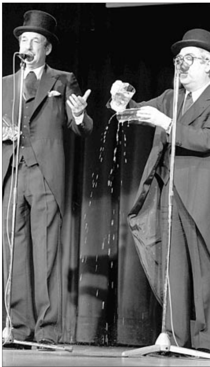
'Tip y Coll', en uno de sus más famosos números de humor.

TVE ofrece esta noche un programa especial en homenaje al humorista presentado por José Manuel Parada.