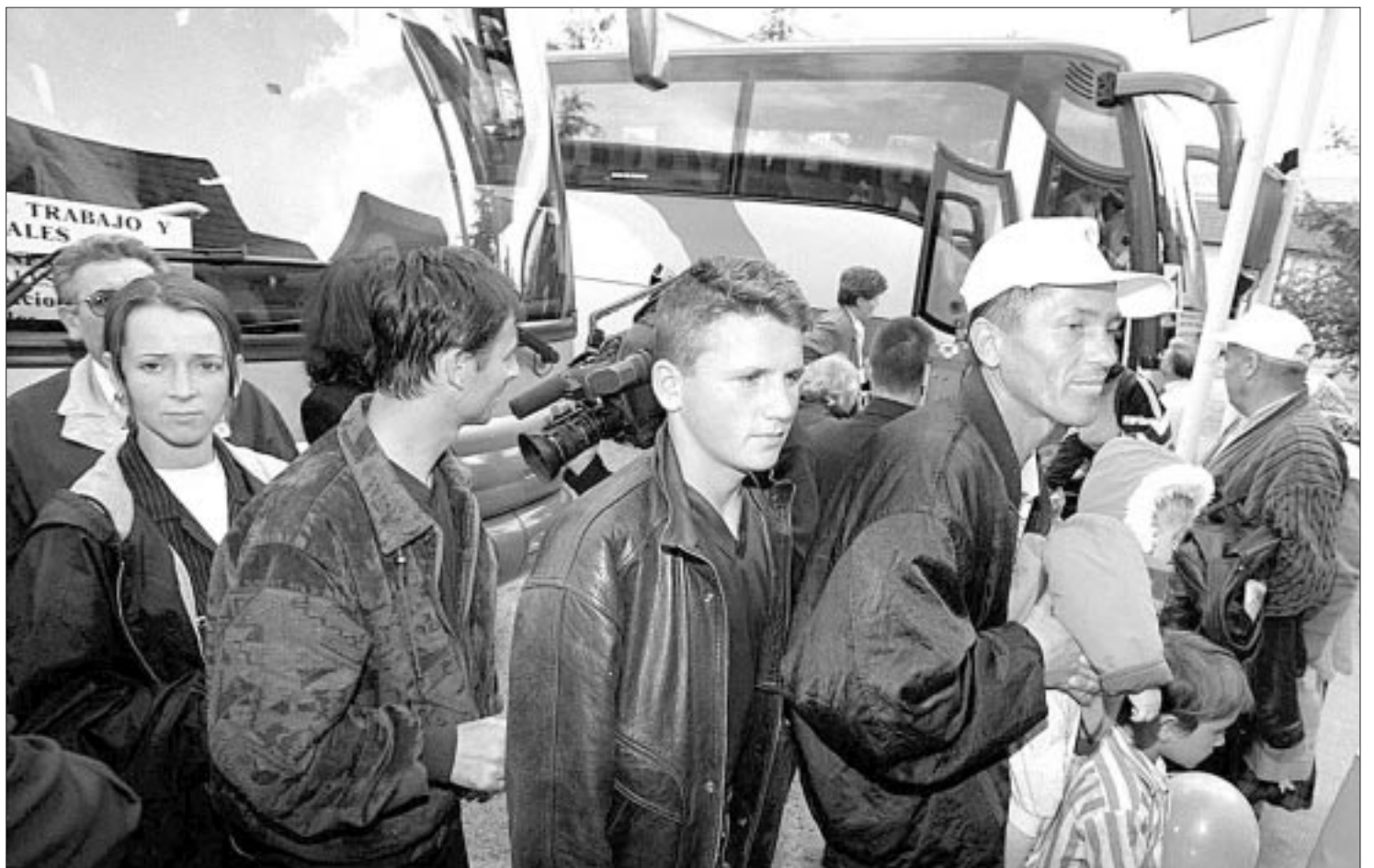
Los miembros de una de las familias kosovares descenden del autocar para introducirse en la residencia de la Junta en Avila.