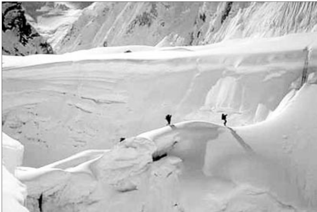
Dos expedicionarios de Castilla y León caminan por el filo de un puente de nieve.