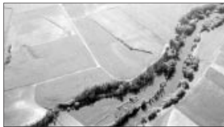
JULIO DEL OLMO

El trazado de Pintia, su muralla, sus calles y sus viviendas, es perfectamente visible a vista de pájaro en algunas fases del crecimiento de los cultivos que se sitúan sobre los restos de piedra. Desde el aire se han conseguido verdaderos planos fotográficos del yacimiento.