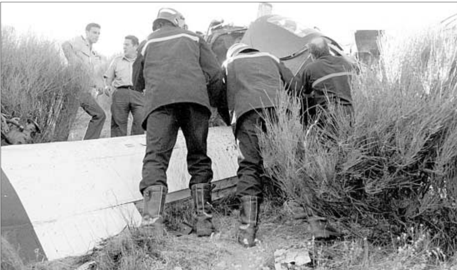
J. R. SAN SEBASTIAN

PALENCIA C/. Cardenal Almaraz, 4. Teléfs. 979 170262. Fax: 979 700776. ZAMORA San Pablo, 2. Teléf. 980 530124 y 530145. Fax: 980 530626. SEGOVIA Travesía Doctor Sancho, 2, 1.º B (esquina Fernández Ladreda). Telfs. 921 427661/420707/34. Fax: 921 442680. SALAMANCA C/. Isaac Peral, 1, 3.º C. Teléf. 923 236196. AVILA Calle Blasco Gimeno 5, 2º C. Teléf. 920 212938. SORIA C/. Las Casas, 14, 3º B. Teléf. 975 226123. BURGOS Camino de Cortes, 25. 09002. Teléf. 947 263871. LEON Avenida de la Constitución, 34. Hospital de Orbigo. Teléf. 987 388356. MEDINA DEL CAMPO Ronda de las Flores, 4. Teléf. 983 803401. Fax: 983 811065.