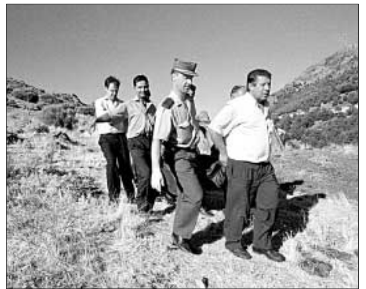
J. R. SAN SEBASTIAN

Los bomberos tuvieron que amarrar los restos de la avioneta para evitar que se acabara por deslizarse hasta el fondo del ba-