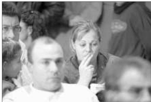
Gesto de tristeza de una de las asistentes al Pleno.