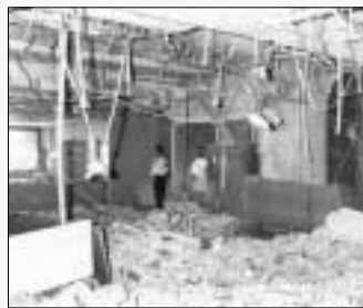
Atentado en el Ministerio de Economía.

5 de septiembre de 1984 Es asesinado en Sevilla el presidente de la Confederación de Empresarios Andaluces, Rafael Padura Domínguez