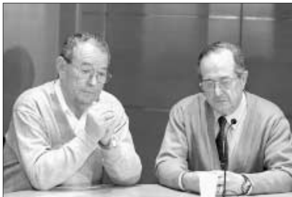
A la derecha, el concejal, tío del fallecido, en el Pleno.