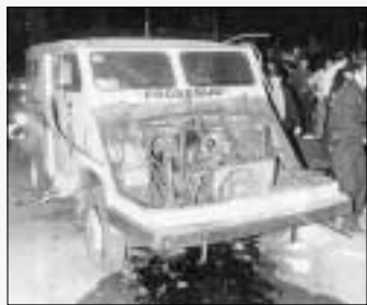
Ataque a un furgón de Prosegur.

29 de abril Asesinan al guardia civil Plácido Pedreira en A Coruña