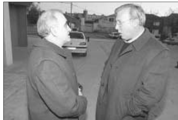
El alcalde y el teniente coronel de la Guardia Civil.