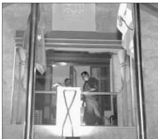
Una mujer sumida en la pena en el Pleno. A la izquierda, el lazo negro en el balcón del Consistorio.

sé lo que es perder un hijo joven y no es el día de hoy ni el de mañana, es el otro y el otro... y siempre preguntándote por qué él»,