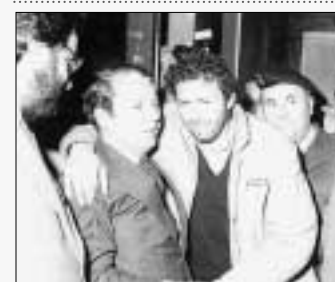
Liberación del futbolista 'Quini'.