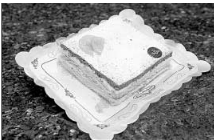
Presentación de las bebidas de la feria en la plaza de la Universidad. Abajo, la tarta de la Virgen.

cogida -no podía faltar el hojaldre, un valor seguro en el paladar de los golosos y la elección del chocolate llevó a sus creadores a apostar por la crema de naranjas la que comercializan estos días 40 pasteleros de la ciudad.