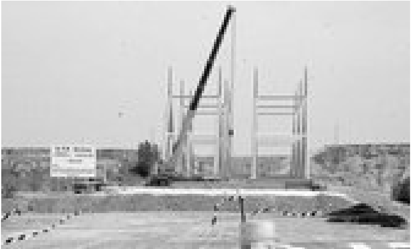
Obras de construcción del tramo de la Autovía del Camino de Santiago entre Carrión de los Condes y Osorno, a la altura de la localidad de Carrión, 7 JUNIO