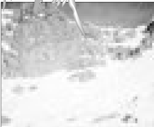
Abajo a la derecha, el refugio del Frade en los Picos de Europa.

hora entre las familias que denunciaron la ausencia de sus hijos a la Guardia Civil.