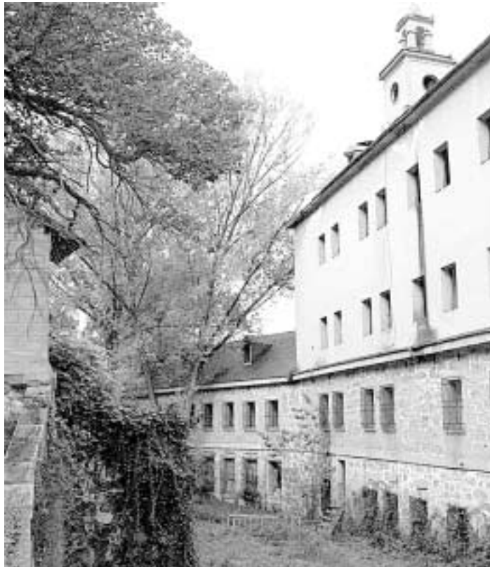
Vista interior del complejo de la Casa de la Moneda.

El portavoz socialista solicitó además que, si no hay en unos días una respuesta de las dos administraciones superiores, el Ayuntamiento se haga cargo de las obras urgentes que eviten la ruina del conjunto hasta que comience la restauración. «Cuenta con nuestro apoyo para sacar los colores al PP, a la Junta y al Ministerio», precisó.