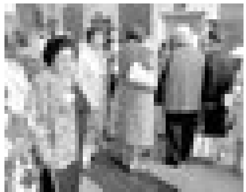
Asistentes al Congreso Nacional de Amas de Casa.