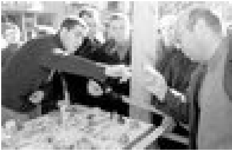
Exposición micológica celebrada en la localidad soriana de Almazán.