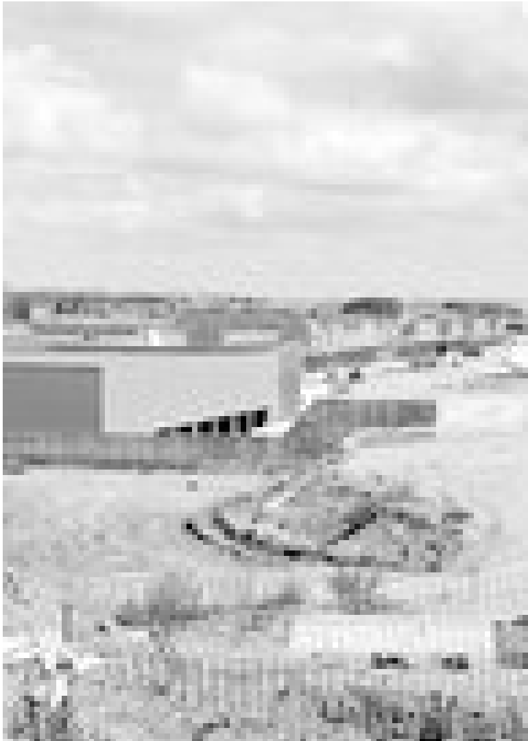
Aspecto de las instalaciones del nuevo centro comercial Vista Alegre. J. LUSCALLEJA

El proyecto, que según la promotora será una realidad en noviembre, tiene un presupuesto de doce millones de euros