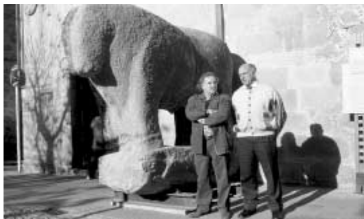
El presidente de la Diputación (derecha) y el artista que ha realizado la rehabilitación, junto al verraco.