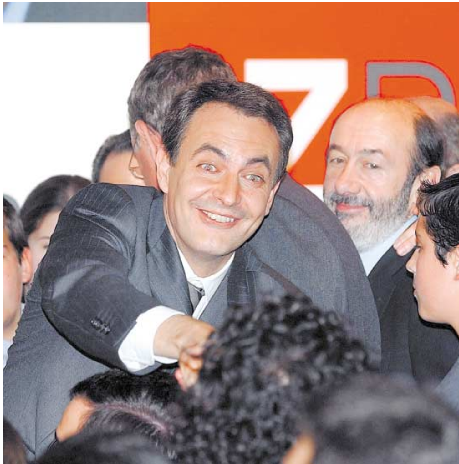
Zapatero corresponde a las felicitaciones de las numerosas personas que se concentraron anoche en la sede socialista.