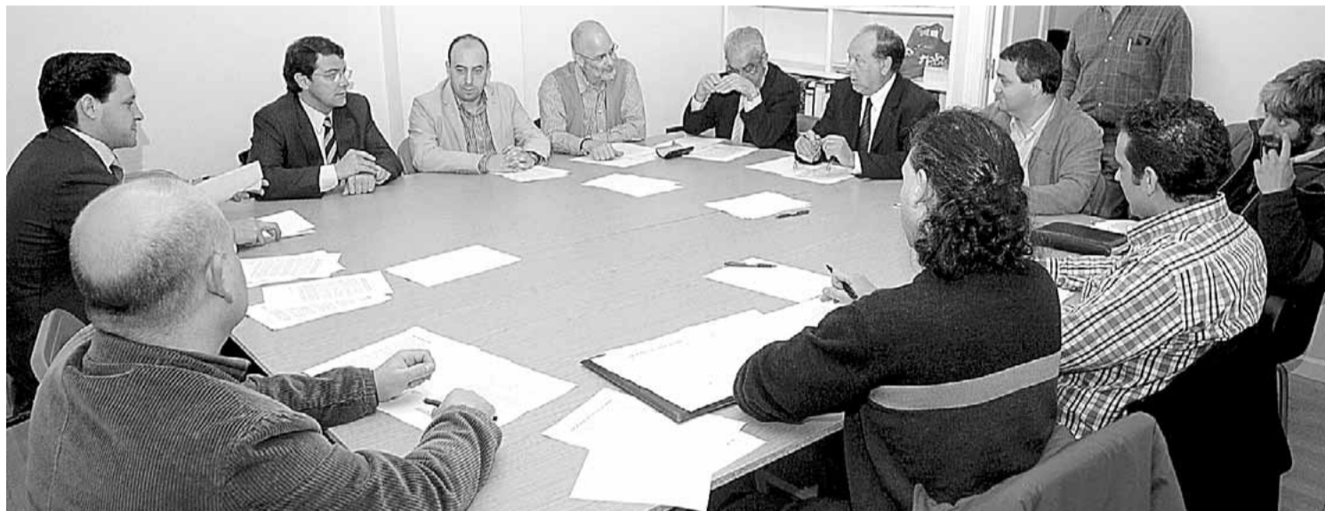
Los representantes de partidos, asociaciones y organizaciones agrarias en la reunión de ayer.

A esto se añadirá la tradicional referencia a la despoblación y las crisis empresariales que en este momento afectan a la comunidad, además de defender la necesidad de respetar el medio ambiente y en especial de apostar por las energías renovables. A tenor del encabezamiento del manifiesto, que es prácticamente idéntico que