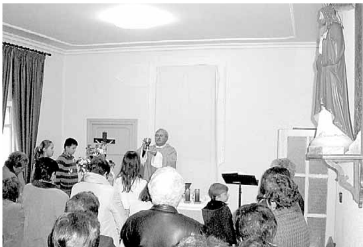
El párroco de Ituero oficia la misa en el salón de plenos, ayer.

Párroco y regidor están de acuerdo en que «esta situación es un peligro para la integridad de las personas, pues se trata de piedras de grandes dimensiones». Además, según el alcalde, «la última de las piedras cayó hace unos días y aplastó una estufa que esta-