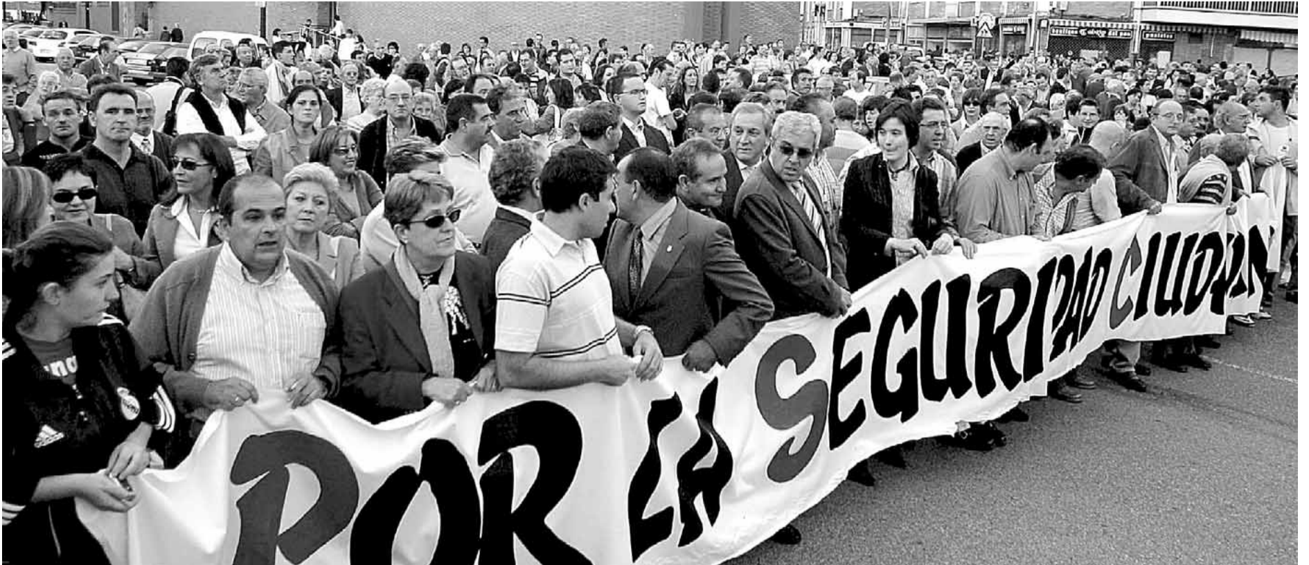
Una gran pancarta en la que se podía leer el lema 'Por la seguridad ciudadana' encabeza la manifestación en las calles de Burgos.