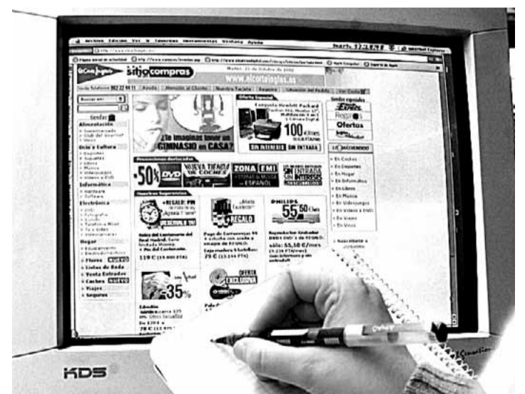
Un usuario anota en un cuaderno sus compras en la Red. / NORTE

Según la Unión de Consumidores, los habitantes de Palencia han pasado en un año de ocupar el último puesto de Castilla y León a ser porcentualmente los segundos, tanto en las compras en Internet como en el número de ordenadores y en la conexión a la Red en los hogares. Así lo ha puesto de manifiesto una encuesta sobre las tecnologías de la información y las comunicacio-