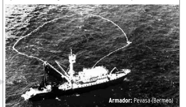
Armador: Pevasa (Bermeo)

Capacidad de la bodega: 1.850 m3. Velocidad en pruebas: 15 nudos