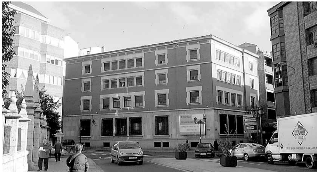
Edificio del antiguo Banco de España, que se transformará en sede judicial.

biliaria de Patrimonio S. A. (Segipsa) la licencia municipal de obras que permitirán la transformación del inmueble para que pueda acoger una parte de los juzgados palentinos, que ahora se encuentran dispersos por diversos edificios de la ciudad. La Comisión de Urbanismo del Ayuntamiento de Palencia dictaminó ayer de forma favorable la concesión de este permiso obligatorio, que debe ser ratificado por la Jun-