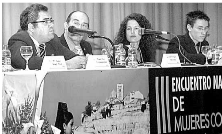
Ponentes de la primera mesa de trabajo del encuentro.

Un intenso debate cierra la segunda jornada del foro nacional, en el que participan 150 representantes de cofradías