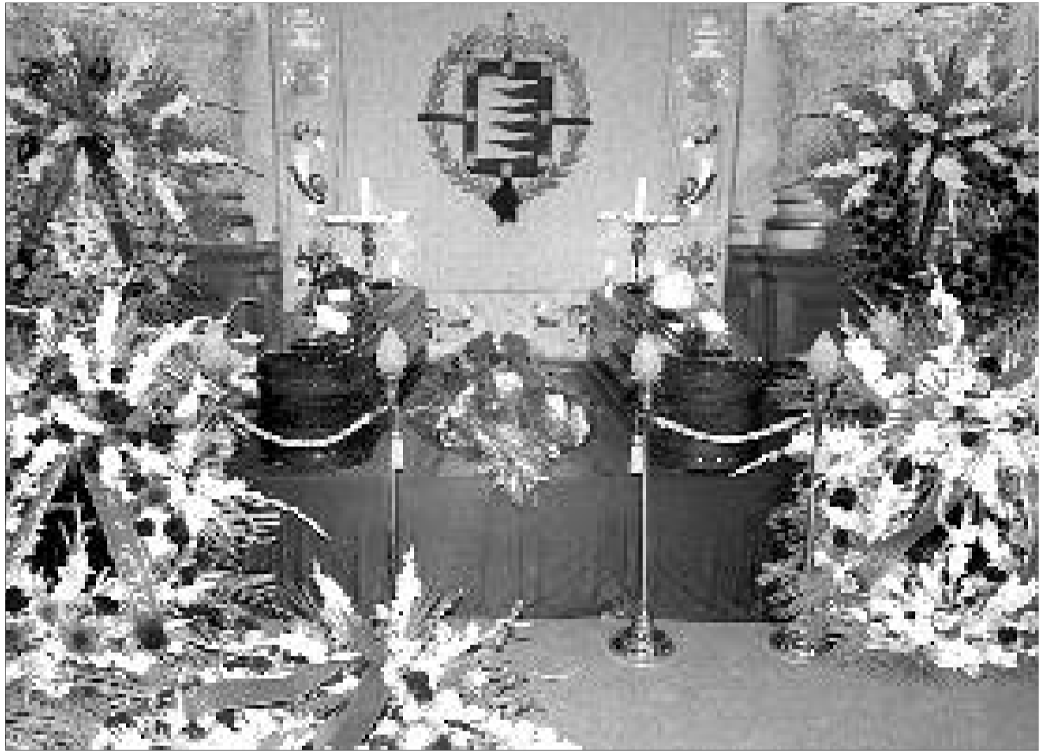
La capilla ardiente se instaló en el salón de recepciones del Ayuntamiento.

Vidal había sido víctima en un incendio al caerle encima una casa en llamas