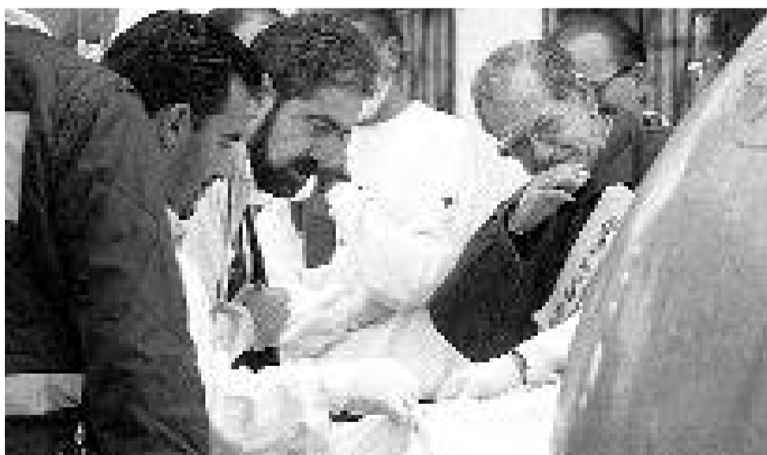
El juez de guardia observa el cadáver calcinado de una de las víctimas.