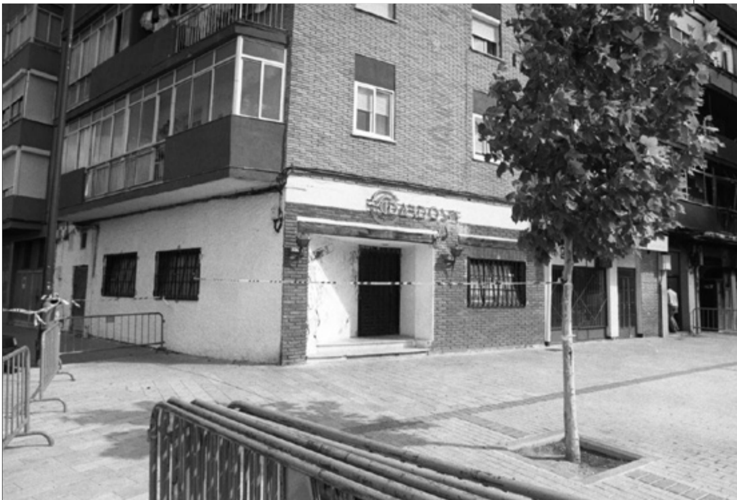
En el extremo de la izquierda se encuentra una salida alternativa -a través de un garaje- que sólo fue utilizada por los bomberos. VILLAMIL

El portavoz de los dueños de discotecas dice que la normativa es adecuada