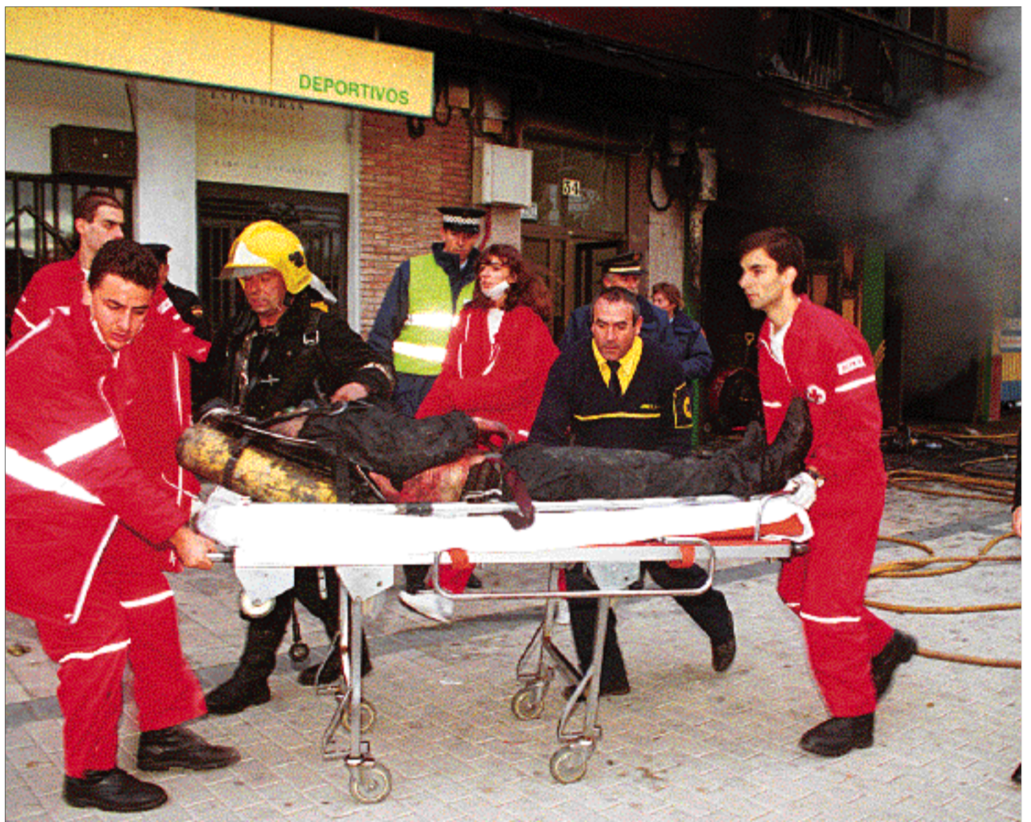
Los equipos de extinción rescatan el cuerpo sin vida de uno de los bomberos.