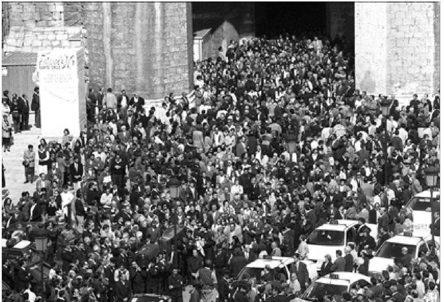
Una multitud de personas abarrotaba los aledaños de la iglesia de San Benito cuando salieron los féretros de los bomberos.

Casi una hora después y entre escenas de dolor de los familiares, los féretros fueron trasladados en dos coches fúnebres hasta el cementerio de Las Contiendas, seguidos de una larga comitiva —que obligó a interrumpir el tráfico— de turismos, coches de bomberos, de la Cruz Roja, de la Policía Municipal, además de varios taxis y cuatro autobuses municipales que el Ayuntamiento puso a disposi-