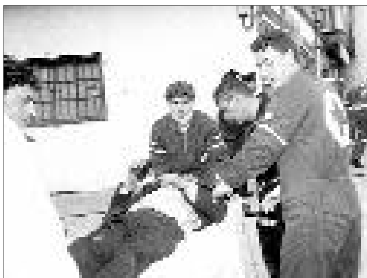
Un bombero es trasladado al hospital.

La Dirección del centro hospitalario vallisoletano ha informado que «otras dos personas afectadas por el incendio permanecerán ingresadas hasta que su recuperación física y emocional aconseje el alta».