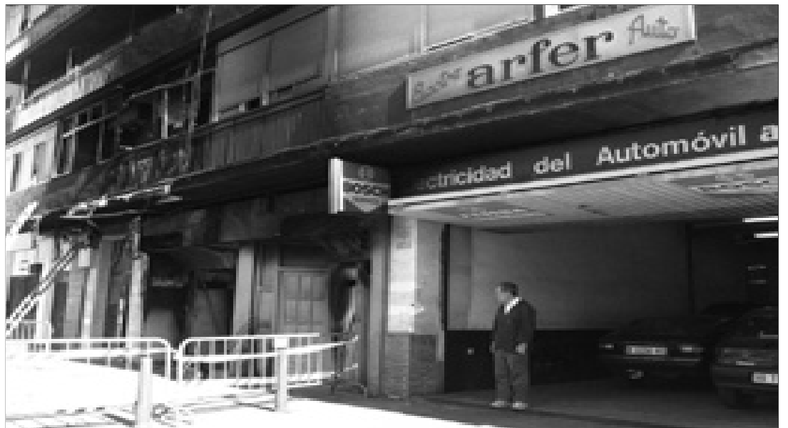
El taller anexo a la entrada de la discoteca no fue afectado y ayer trabajó con normalidad.

Casualmente, la vivienda más afectada corresponde a un jubilado, la persona, según los vecinos, que más veces se ha quejado de los problemas que le causaba la discoteca.