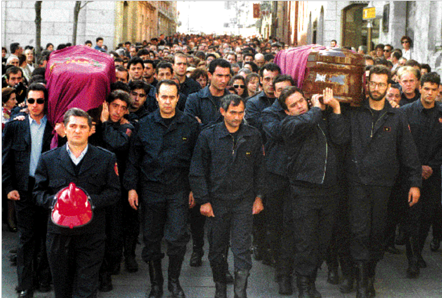
Compañeros de los bomberos fallecidos trasladan los féretros a la iglesia de San Benito.