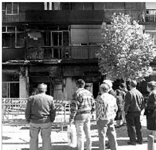
Varios curiosos contemplan el desastre (izquierda), mientras un policía custodia la entrada a la sala.