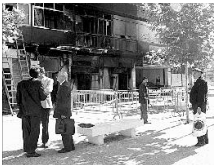
Exterior vallado de la discoteca siniestrada.

Sin embargo, un testigo de los hechos citado por la agencia Efe, llamado Lucio, dedujo que el incendio podría haber sido fortuito y que estaría localizado en el panel de interruptores, porque, según su versión, «vi el panel completamente rojo cuando comenzaron las llamas».