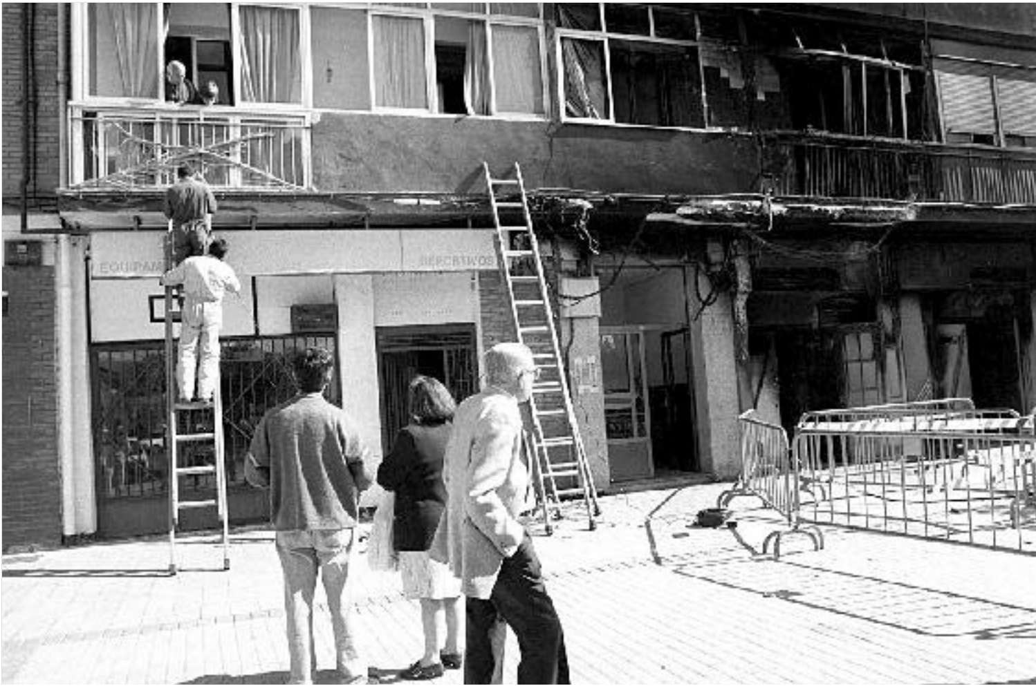
Dos trabajadores reparan los cables de la línea telefónica ante la mirada de algunos residentes en el edificio.